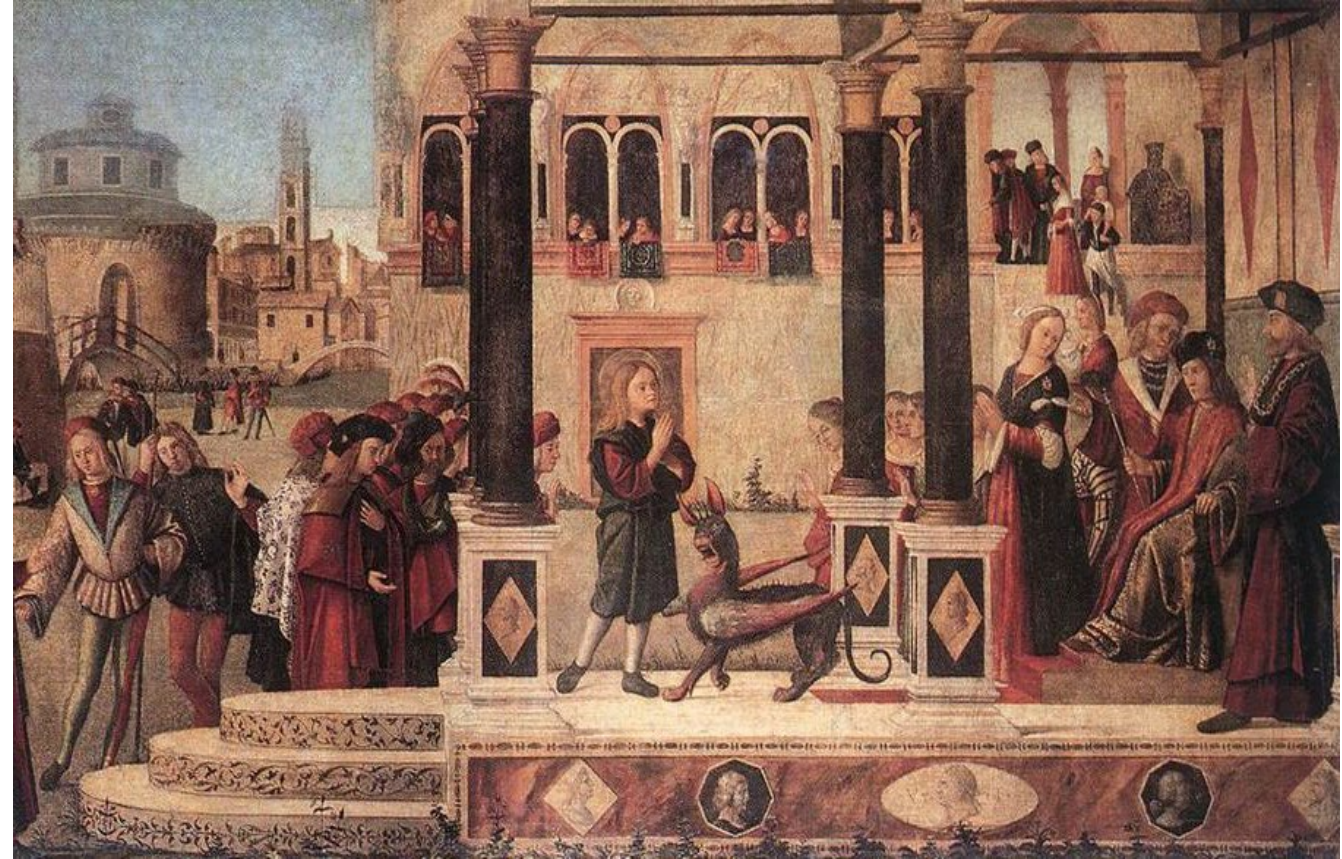
Святой Трифон изгоняет беса из дочери императора Гордиана. Витторе Карпаччо. 1507г.

Которые же не веруют в Бога и Сына Божия и, будучи послушны своим похотям, творят угодные нам дела, над теми мы получаем полную власть, чтобы мучить их.