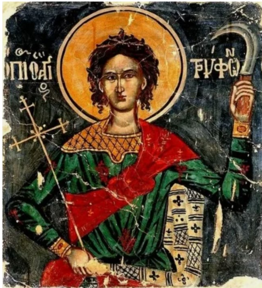
Святой мученик Трифон Апамейский. Фреска. Греция, 1751г. Византийский музей в Афинах.