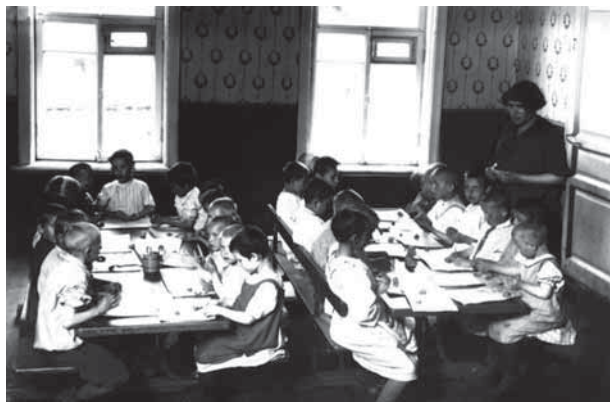
Воспитанники приюта-яслей Попечительства по охране материнства и младенчества во время занятия лепкой. Петроград. 1915 г.

беженцы, для детей открывались карантинные дома, где дети выдерживались 18 дней, а затем направлялись или в приюты, или во временные небольшие больницы по разным инфекциям (коревые, коклюшные и др.).