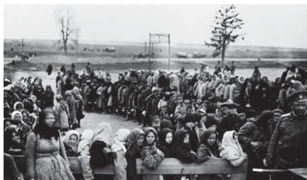
Дети-беженцы в очереди за хлебом и сахаром у врачебно-питательного пункта, организованного отрядом РОКК, созданным на средства В. М. Пуришкевича. Бобруйск. 1915 г.

Категории детей, которым оказывалась помощь, менялись в зависимости от хода военных действий и связанной с ними обстановки в стране. Вначале помощь оказывалась только особо нуждающимся детям воинов, выявляемым в результате поданных прошений и проведения обследования. В этом большую роль сыграли городские Попечительства о бедных.