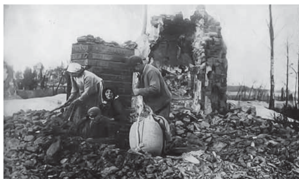
Поляки на развалинах своего дома

Смертность среди детей-беженцев до 10 лет в 4 раза превышала смертность коренного населения. Немало детей становились сиротами, остав в дороге от своих семей, либо лишившись родных.