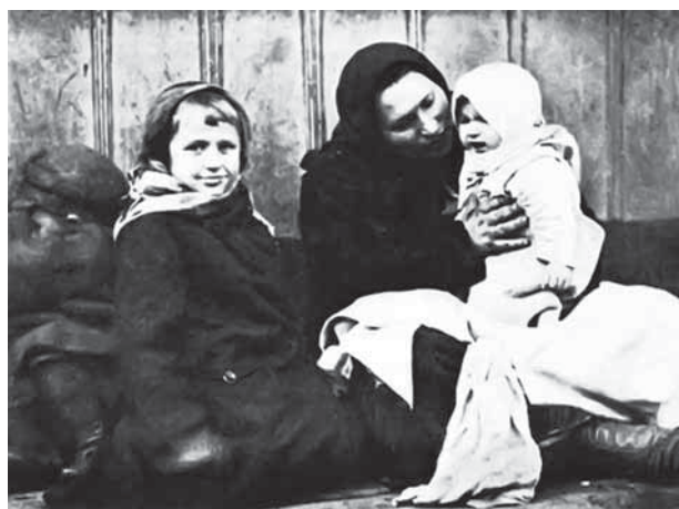
Беженцы. Ежедневник «Летопись войны 1914–1917 гг.» № 062. 1915 г.

С июля 1915 г., когда из юго-западных районов России двинулись потоки беженцев, причем более 60% из них составляли дети, по-