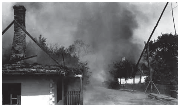
Пылающая деревня на Восточном фронте. Польша. 1915 г.

Смертность среди детей-беженцев до 10 лет в 4 раза превышала смертность коренного населения. Немало детей становились сиротами, остав в дороге от своих семей, либо лишившись родных.