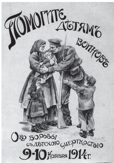
Помогите детям воинов. Плакат Общества борьбы с детской смертностью. 1914 г.