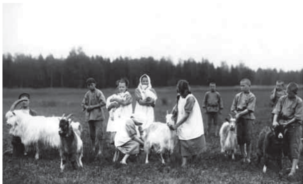
Воспитанницы приюта Общества помощи бесприютным и беспризорным детям призванных на войну доят коз. Новгородская губерния, ст. Торбино, имение «Отрадное». 1916 г.

В Москве среди 12 пунктов, где оказывалась медицинская помощь всем беженцам, было 3 амбулатории для грудных детей, там же выдавалось питание. Кроме того, в «Доме грудного ребенка», руководимом Г. Н. Сперанским, была организована амбулатория и распределительный пункт для грудных детей.