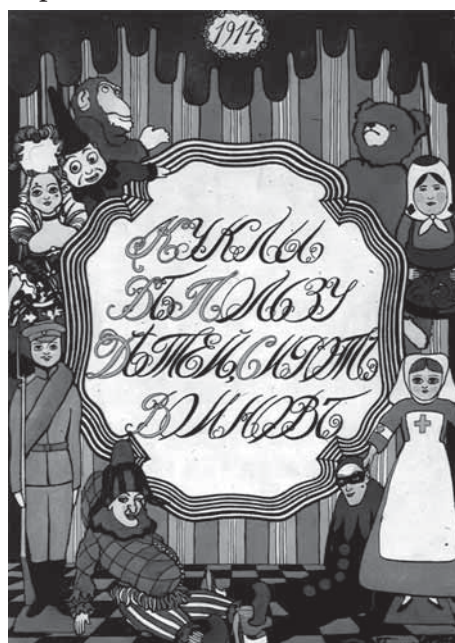
Куклы в пользу детей, сирот воинов. Художник Л. М. Браиловский. 1914 г.