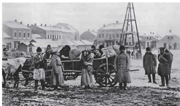
Беженцы из Галиции